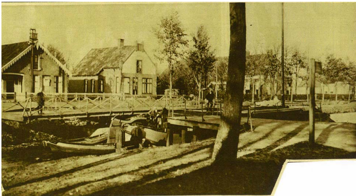
rechte kanalen, de „Monden”, gaan uit het hoofdkanaal naar 't Veen, dat nog geheel of gedeeltelijk „aan snee” is. Het geheele stelsel is wel vergeleken met de tanden van een hark, 't Stadskanaal is de steel en sire zit aan 't handvat?? om de centjes bijeen te harken?... de Stad! In de uitgestrekte bezittingen is dit een aardig plekje: de Weerdinger brug bij de Weerdinger Mond (gegraven in 1870).